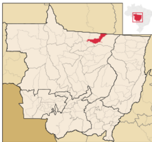
Tabela 1: Estimativa da população residente em Matupá